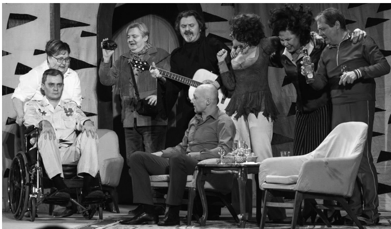
Сцена из спектакля «Одноклассники» Центрального академического театра Российской армии. Постановка Б.А. Морозова