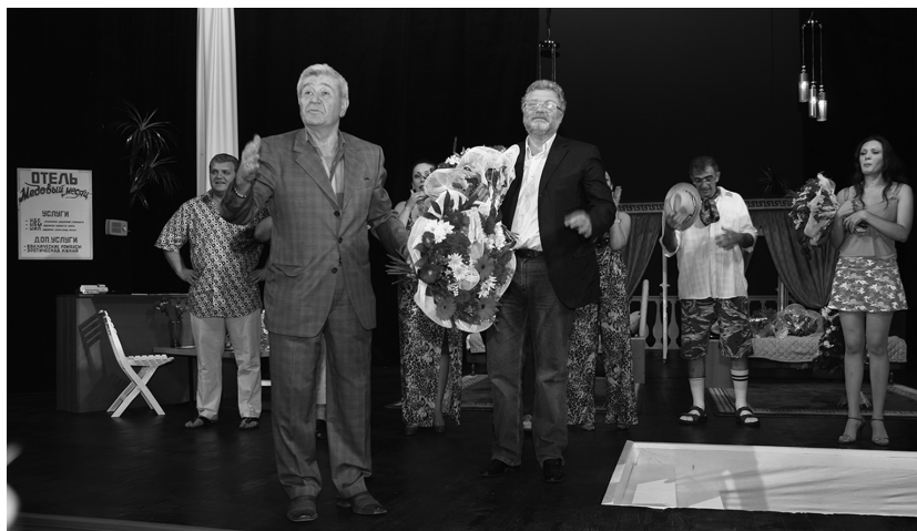
На поклон. Спектакль «Отель “Медовый месяц”» Ереванского русского театра. Художественный руководитель А.С. Григорян и автор Ю.М. Поляков