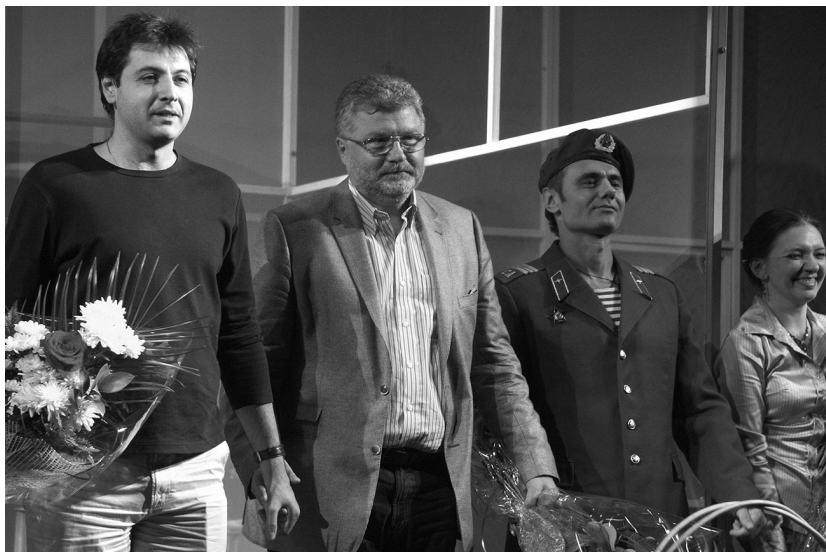
Премьера спектакля «Одноклассники» Нижегородского академического драмтеатра имени Горького

писатель-классик, лауреат всех премий, начиная с квартальной, узнавая, что готовится суровый разбор его очередного романа, каждый раз объявлял себя смертельно больным. Но едва сердобольный редактор снимал из номера строгую рецензию, заменив ее теплым прощальным откликом, классик выздоравливал. Жив он и поныне.