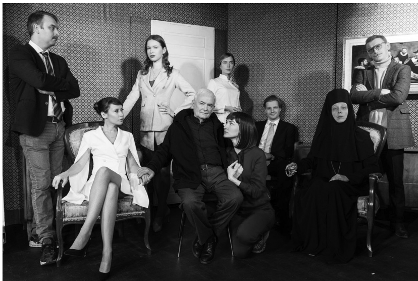
Сцена из спектакля «В ожидании сердца» театра-студии В. Н.Шиловского

Лютиков. Тихо, кур-баши, здесь уже слушают.