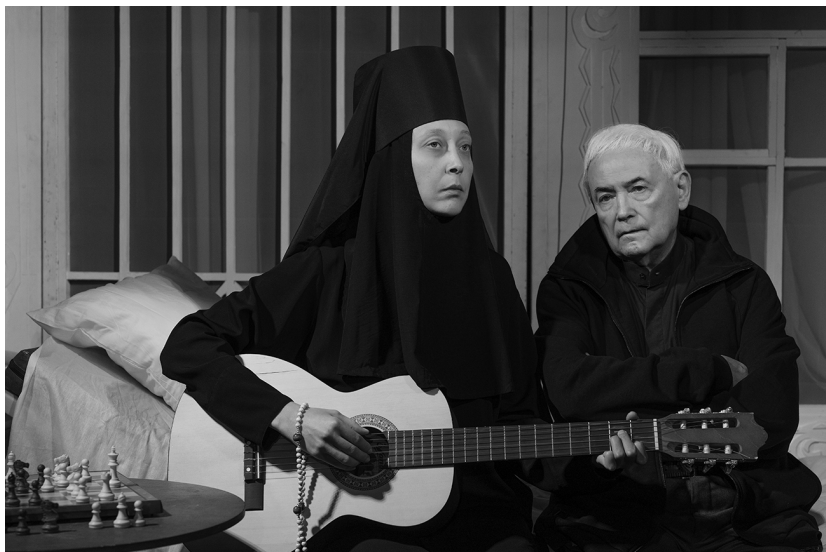
Сцена из спектакля «В ожидании сердца» театра-студии В.Н. Шиловского

Алапаев. Марин, а помнишь, как мы на картошке у костра пели?