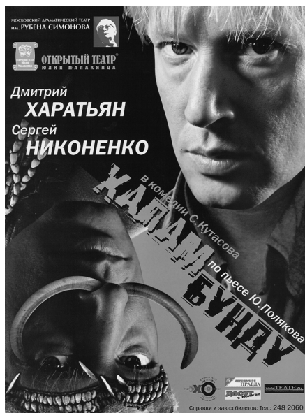
Афиша спектакля «Халам-бунду». 2000 г.

один из персонажей — Костя Куропатов, отец главной героини. Его текст актеры поделили по-братски, отчего на сцене начался антисюжетный ужас. Я ждал, когда зрители начнут свистеть, как на стадионе, если мазила-нападающий бьет мимо пустых ворот. Но зал, включая моих друзей, с интересом наблюдал за происходящим на сцене, хохоча над репризами. Едва сошелся занавес, я помчался в гримерку, чтобы устроить скандал, и узнал: исполнителя роли Кости в антракте увезли с сердечным приступом.