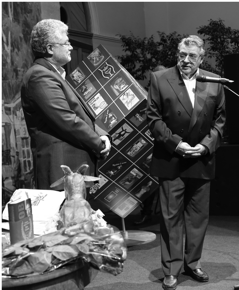
Ю.М. Поляков и А.А. Ширвиндт. 60-летие автора