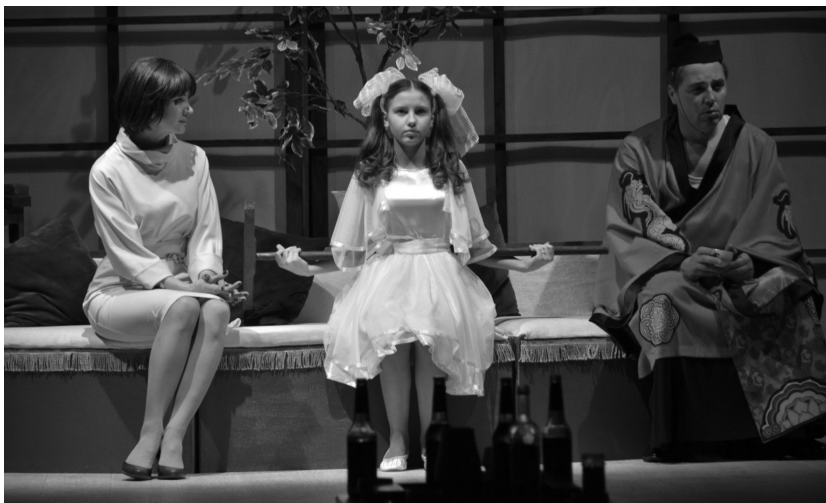
Сцена из спектакля «Как боги...» Белгородского государственного академического драматического театра им. М.С. Щепкина

Максим. Тетя Вера, не смотрите на это! На это нельзя смотреть!