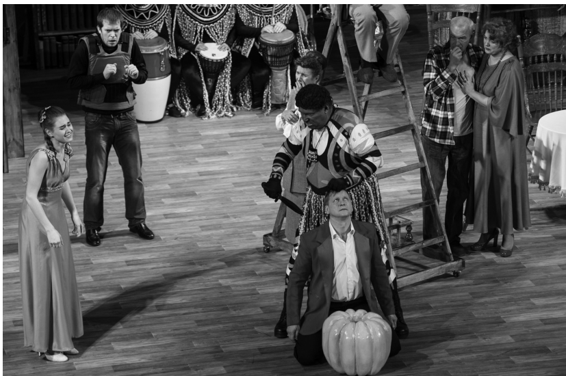
Сцена из спектакля «Халам-бунду» Иркутского драматического театра им. Н.П. Охлопкова

Юрий Юрьевич. Я буду теперь часто вспоминать, какая вы красивая в этом платье!