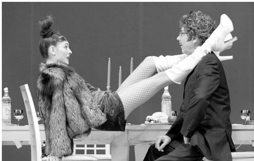
Сцена из спектакля «Хомо Эректус». Театр сатиры (Москва). Июнь, 2005

2019 года мы закрывали «Смотриньы» 384-м спектаклем, и в огромном зале на 1200 мест не было ни одного свободного кресла. Покажите мне хоть одну «новодрамовскую» пьесу с такой судьбой! Не покажите.