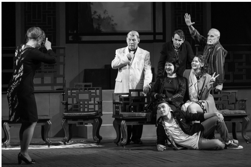
Сцена из спектакля «Халам-бунду» Хабаровского краевого театра драмы