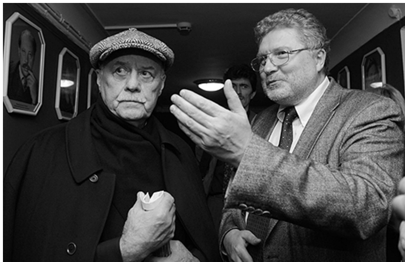
С.С. Говорухин и Ю.М. Поляков

русскими». «Отлично! — кивнул Говорухин. — То, что надо: старая советская квартира, орденоносный дед, никчемные дети, мятущаяся внучка, за которой ухлестывает нахрапистый бизнесмен. Остальное придумаем!» Придумали. В моем архиве хранится первый вариант «Смотрин» с роскошно-нецензурными замечаниями Говорухина. Пьесу закончили в 2000 году и отдали, как договаривались, в Театр имени Вахтангова. Прочитав, Михаил Александрович грустно молвил: «Слишком остро. Меня там не поймут...» — и показал в сторону Кремля, где досиживал последние месяцы всенародно избранный дирижер немецкого оркестра. Да, читатель, да, экранный Ульянов, будучи Жуковым, не боялся даже Сталина! Впрочем, мне и потом приходилось сталкиваться с актерами, чей экранный образ отличается от жизненной позиции, как шахид от хасида.